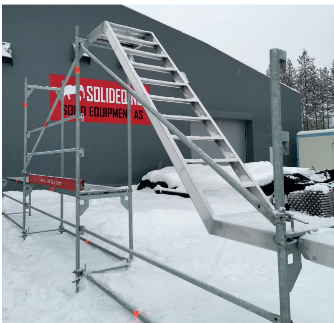
7. Videre monteres fotlist og diagonalstag for å avstive stillaset der fagene er ferdig bygget. Det første diagonalstaget skal peke oppover i samme retning som den største trappen. Diagonalstagene festes i en W-form bortover rampen som vist på bildet.