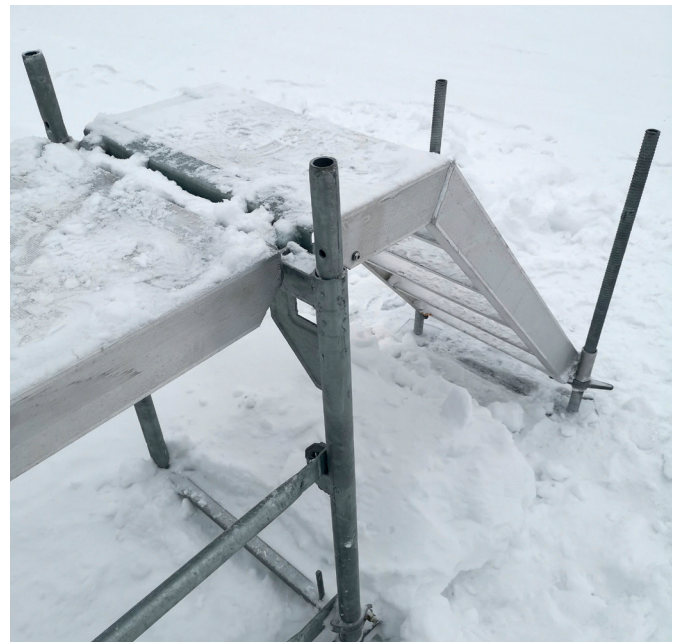
6. Den minste trappen monteres og høydejusteres likt som rammene i bunnen av rampen med bunnskruer.