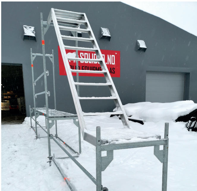
5. Monter trapper.