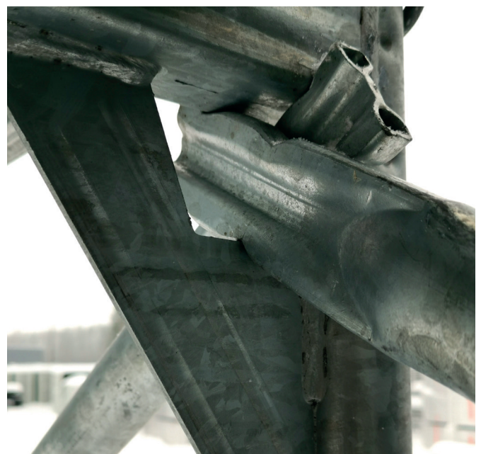
8. Diagonalstagene festes i hakkene inni rammene som vist over.